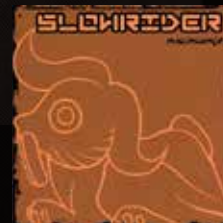
"NACIMIENTO" (2001) SLOWRIDER De Volada Records