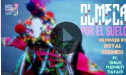
Directed by Olmeca Produced by Witchdoctor Vision Starring Tinkus Wapury's Tiataco (Traditional Bolivian Dance Group)