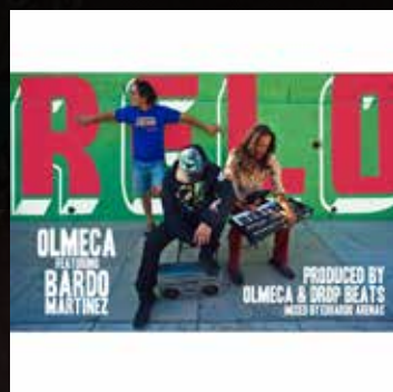
"RELO" Brown Is Beautiful 2013 DOWNLOAD