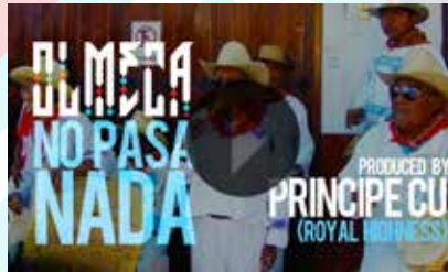
Directed by Olmeca Produced by Witchdoctor Vision DP Michael Beserra