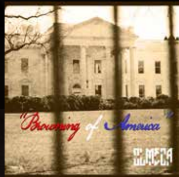
"BROWNING OF AMERICA" Brown Is Beautiful 2013 DOWNLOAD