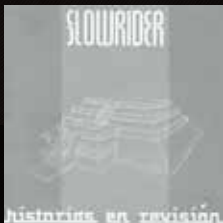
"HISTORIAS EN REVISION" (2004) SLOWRIDER Nomadic Sound System