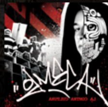
"COUNTER CULTURE" (2010) OLMECCA Released independently