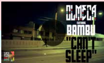
Directed by Olmeca Produced by Witchdoctor Vision DP Michael Beserra