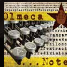
"NOTES" (2008) OLMECCA Released independently