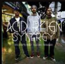
"SYNERGY" (2014) ACID REIGN Acidlab Records