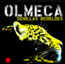
"SEMILLAS REBELDES" (2006) OLMECCA Nomadic Sound System