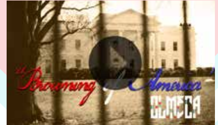
Directed by Olmeca Produced by NDLO & Puente Vision DP Barni Qaasim & Jenn Lawhorne