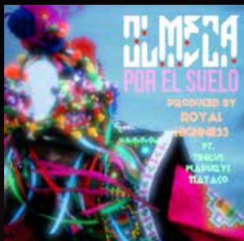
"POR EL SUELO" Brown Is Beautiful 2013 DOWNLOAD