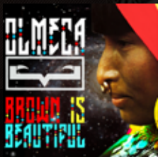
"BROWN IS BEAUTIFUL" (2013) OLMECCA Acidlab Records