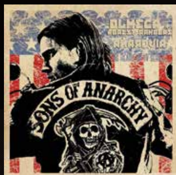
"ANARQUIA" FX TV Series Sons of Anarchy 2011 DOWNLOAD